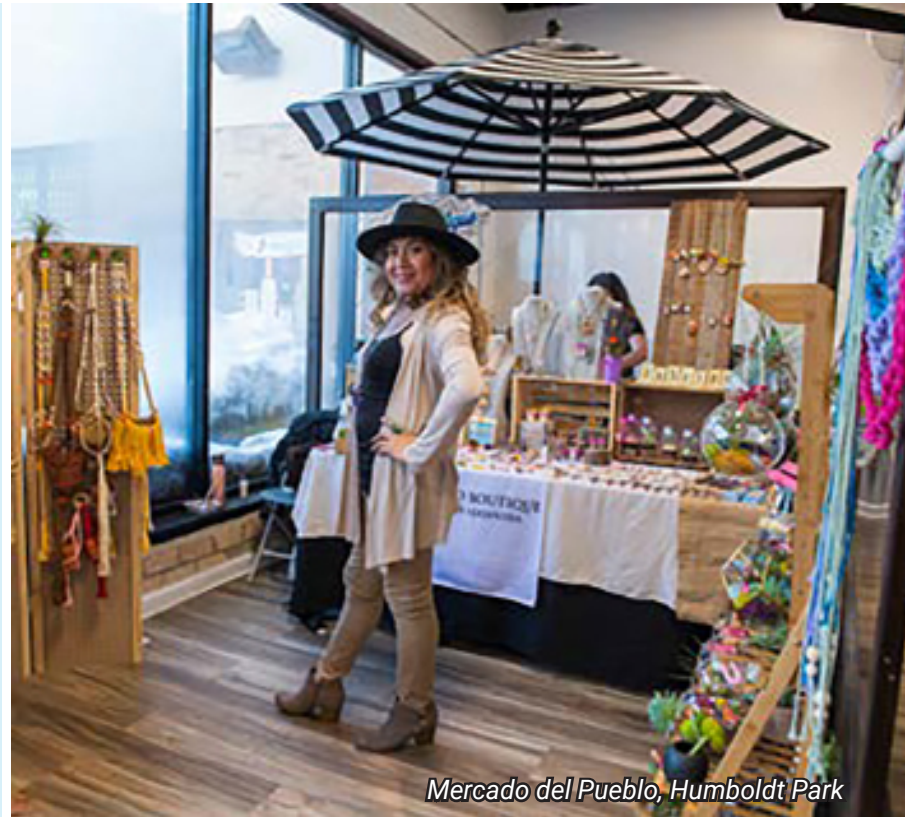
Mercado del Pueblo, Humboldt Park