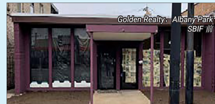
Golden Realty, Albany Park SBIF 前