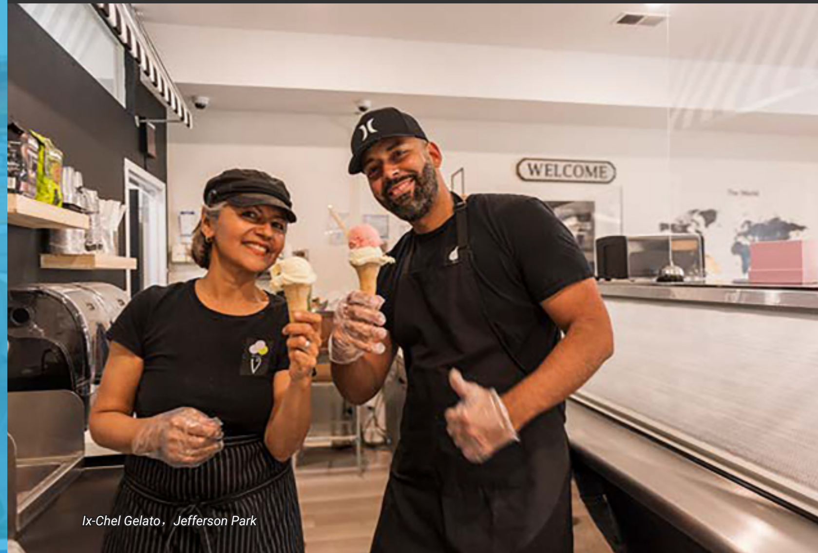
Ix-Chel Gelato, Jefferson Park