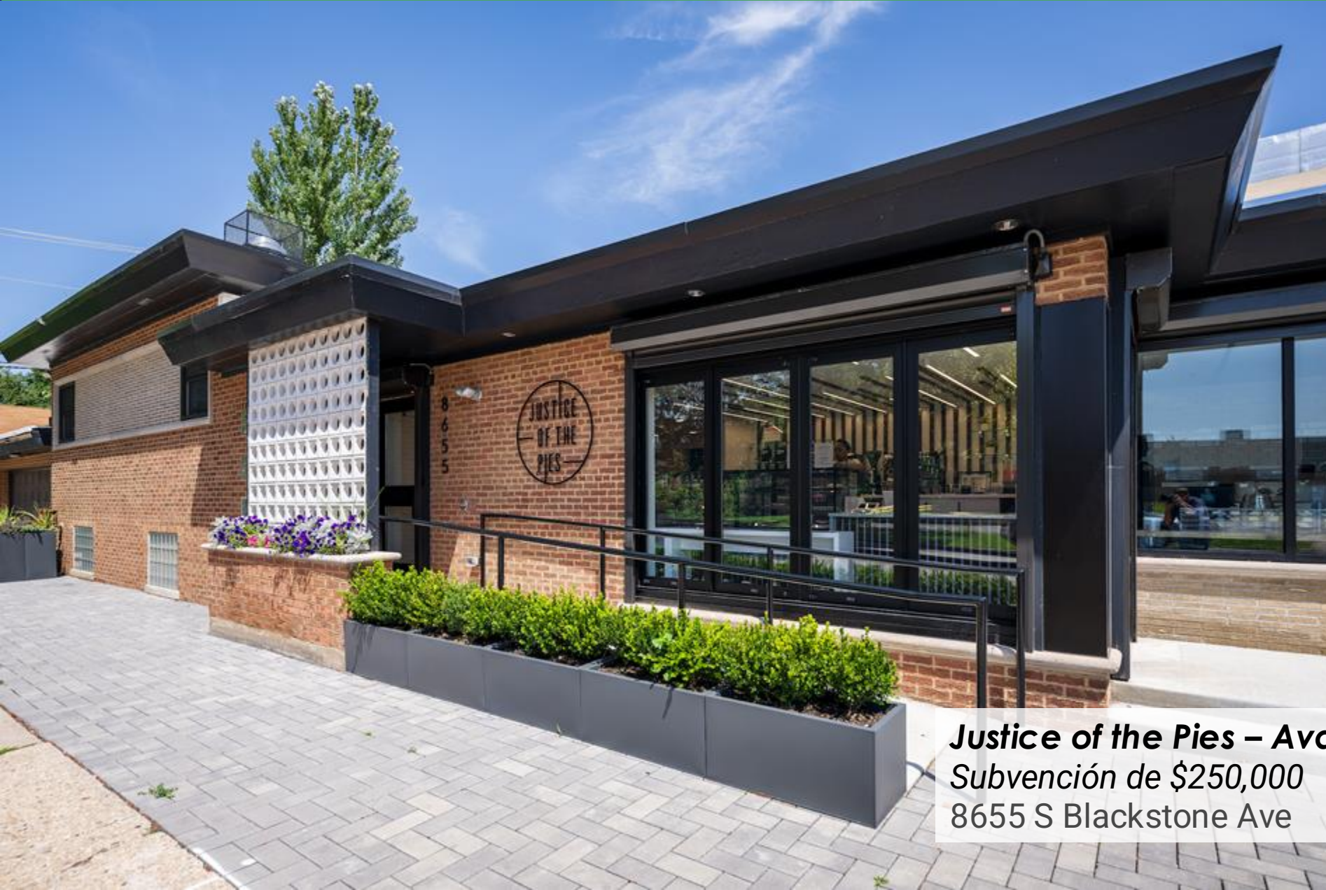
Justice of the Pies – Avalon Park Subvención de $250,000 8655 S Blackstone Ave