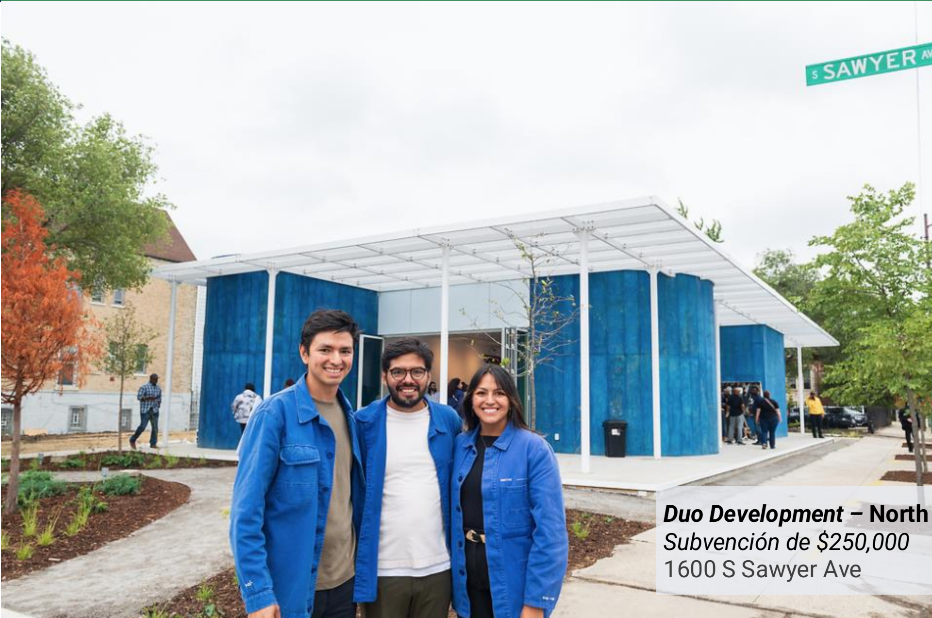
Duo Development – North Lawndale Subvención de $250,000 1600 S Sawyer Ave